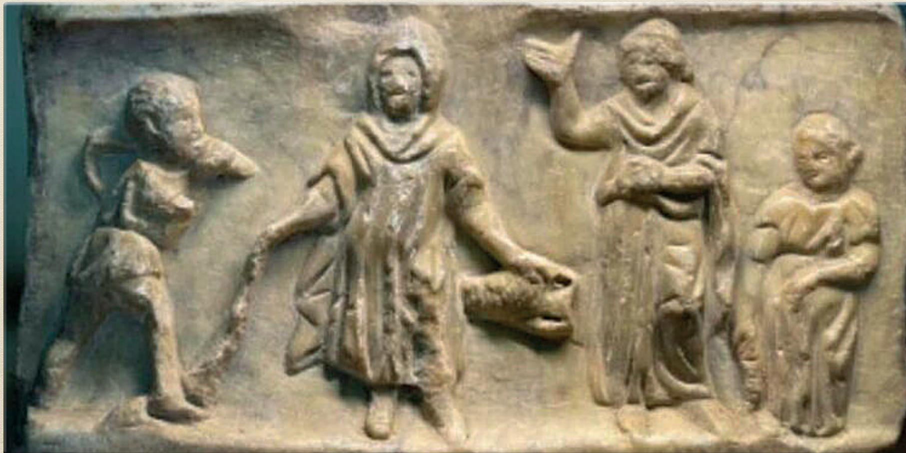
Urna cineraria in San Giacomo Apostolo a Furore (SA)

Biblioteca Comunale di Amalfi "Pietro Scoppetta"